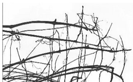
Wübben, Tusche auf Tuch Foto: G.Wübben

Die Ausstellung ist bis Sonntag, den 23.2.2025 zu sehen und jeweils samstags von 16-18 Uhr und sonntags von 12-18 Uhr geöffnet.