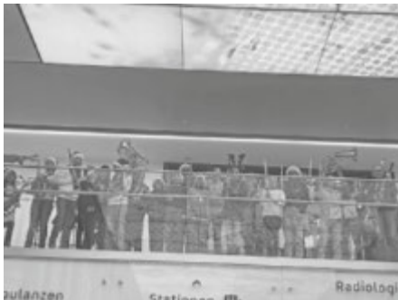
Musizieren in der Kinderklinik in Freiburg