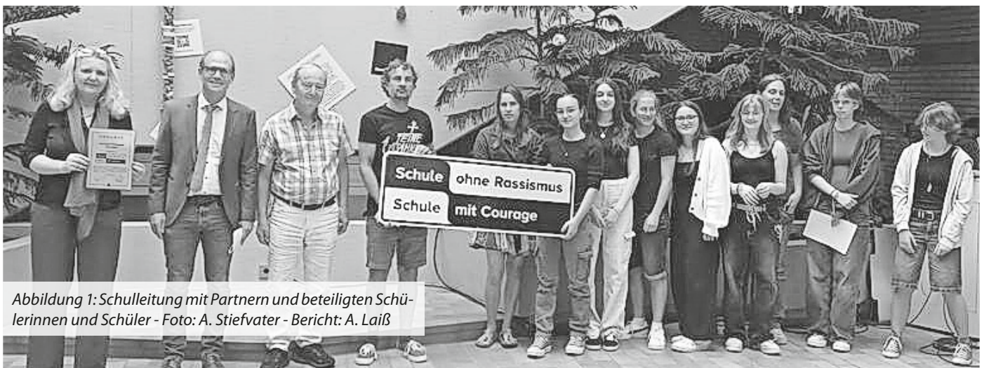
Abbildung 1: Schulleitung mit Partnern und beteiligten Schülerinnen und Schüler - Bericht: A. Laiß

Als „Schule ohne Rassismus“ geht das MSG eine Kooperation mit dem „Helferkreis für Geflüchtete“ ein, der in Breisach eine sehr wertvolle Arbeit leistet. Die Schulgemeinschaft will in Zukunft enger mit dem Helferkreis zusammenarbeiten und schauen, wo Hilfe benötigt und von Schüler*innen geleistet werden kann. So konnte das diesjährige Sommerfest des MSG dazu genutzt werden, Kinderfahrräder zu sammeln. Diese kann nun der Helferkreis dahin verteilen, wo sie gebraucht werden und eine Freude machen können.