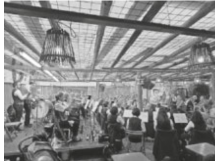
Hahlerifest Gottenheim

Jugendorchester: Montags von 18:15 - 19:15 Uhr