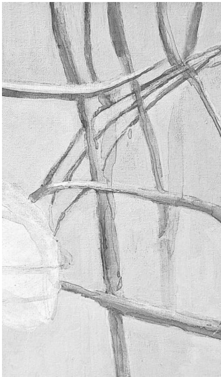
Petra Blocksberg: o.T., Acryl a. Baumwolle, 2022 (Ausschnitt)

Bis zur Finissage am 20.10. um 16 Uhr ist die Ausstellung jeweils samstags von 16-18 Uhr geöffnet sowie sonntags von 12-18 Uhr.