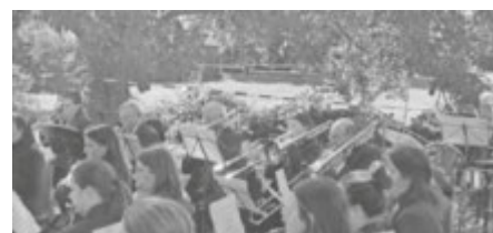
Auftritt in Opfingen beim Zwiebelkuchenfest

Samstag, 28.09.2024 Familienwanderung mit dem Musikverein 18. bis 20. Oktober 2024 Hütten- und Probewochenende von Bläserklasse und Jugendorchester