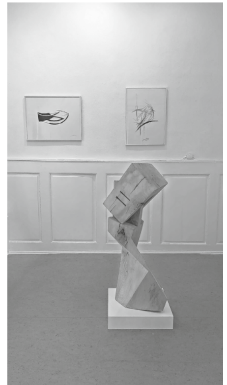
Frau mit Haube

Karten können auf der Homepage unter www.merdinger-kunstforum.de/reservieren vorbestellt werden.